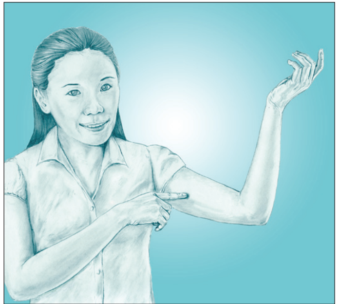
這個植入管會被放在女士上臂的皮膚下

避孕植入管對避孕有非常好的效果。使用植入管一年的婦女每 100 位中不到 1 位會懷孕。