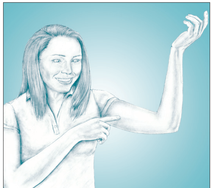
Имплантат вводится под кожу верхней части руки женщины.

Имплантат эффективное средство предупреждения беременности. На 100 женщин, использующих имплантат в течение года, приходится менее 1 случая беременности.