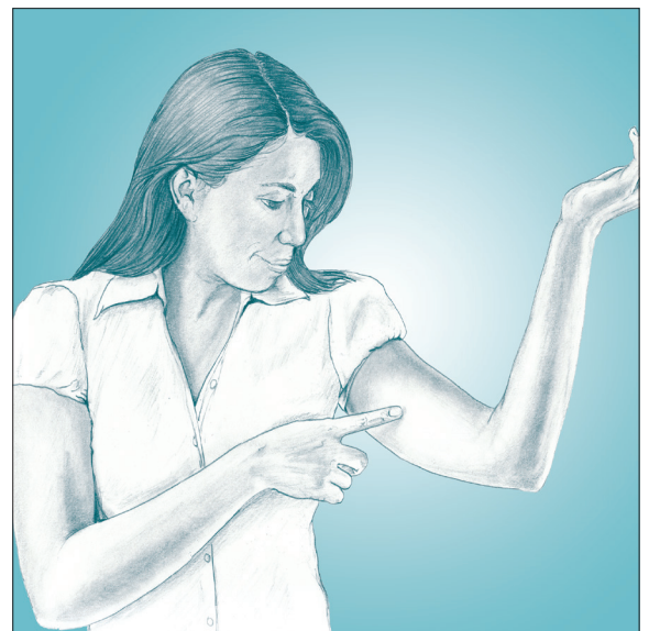
El implante se coloca debajo de la piel, en la parte superior del brazo de la mujer.