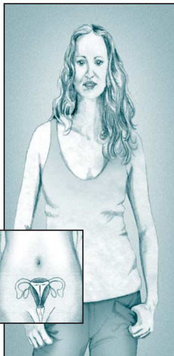
Este DIU se coloca en el útero.