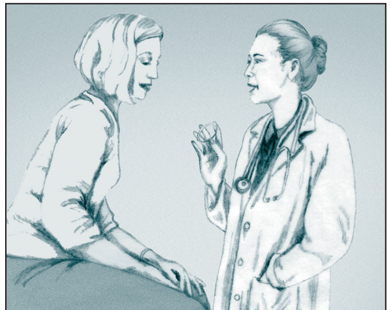
Su proveedor le enseñará cómo usar el anillo.